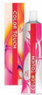
Wella Colour Touch Přeliv 60 ml