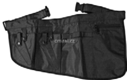
Kapsa na nářadí velká 198 Kč