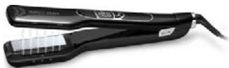
ULTRON Perfect Stream parní rovnáč, 150°C – 230°C, žehlicí plocha 30x85 mm, kabel 2,8 m, LCD displej, vodní nádržka na 40 ml Akční cena 2390 Kč