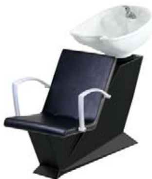
Mycí box Diva.Tech/Caro Běžná cena 13.330,- Akční cena 11.900,-