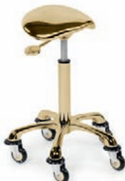
Taburet zlatý Akční cena 4.300,-