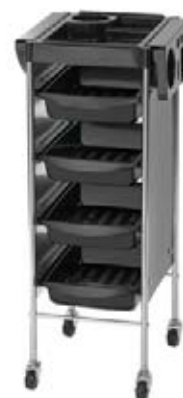
Vozík Passy Akční cena 1.490,-