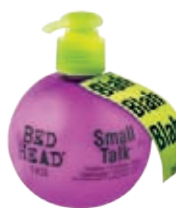
Tigi Small Talk Krém pro zvětšení objemu 3v1 200 ml