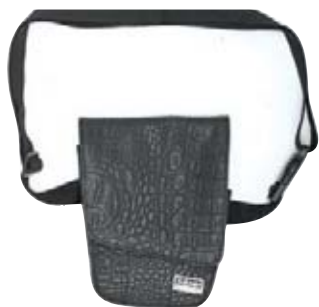
Pouzdro na nářadí Trio 220 Kč