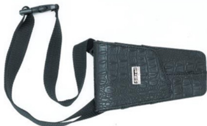
Pouzdro na nůžky Slim Boy 2 190 Kč