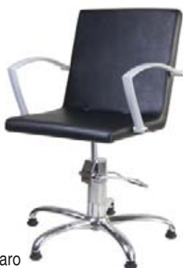
Křeslo Caro Běžná cena 6.730,- Akční cena 5.790,-