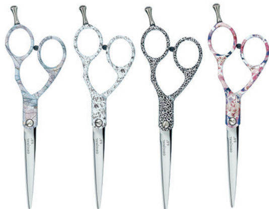
Nůžky Concave nové vzory Cena 890 Kč