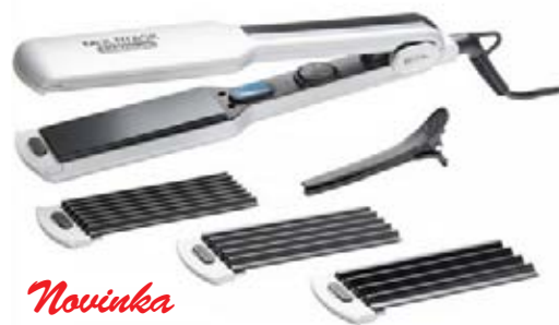
Novinka Žehlička + krepovač Multitask Titanium 4 výměnné nástavce, teplota 230°C Povrchová úprava Soft Touch Akční cena 1590 Kč