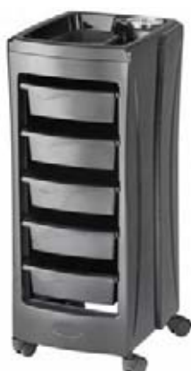
Vozík Brillante Akční cena 2.600,-