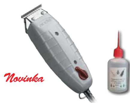
Novinka ANDIS T-Outliner Síťový strojek, tichý chod, dlouhá životnost + mazací olej 100 ml ZDARMA Akční cena 2980 Kč