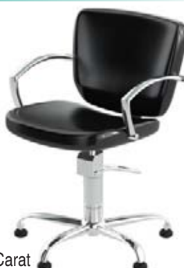
Křeslo Carat Běžná cena 8.720,- Akční cena 6.980,-