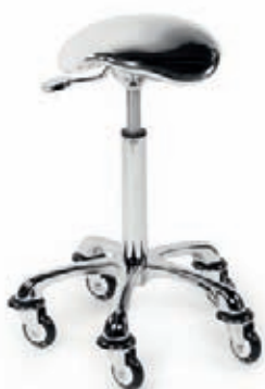
Taburet stříbrný Akční cena 3.990,-