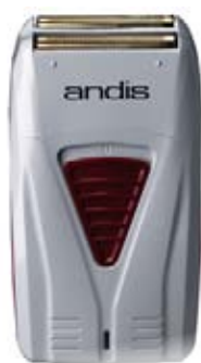
ANDIS Pro Foil Pro závěrečné vyholení vlasů a vousů, výdrž akumulátoru 60 min Akční cena 2890 Kč