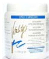
Vitality's Melír Blu 500 g