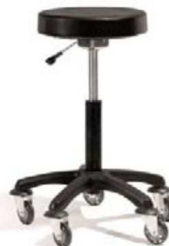
Taburet Round Akční cena 2.290,-