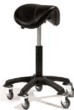
Taburet Saddle Akční cena 2.990,-