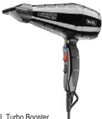
WAHL Turbo Booster 2400 W nano-silver technologie, 3m kabel, 2 rychlosti, 3 teploty Akční cena 1590 Kč