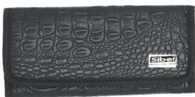
Pouzdro na nářadí Case 2 130 Kč