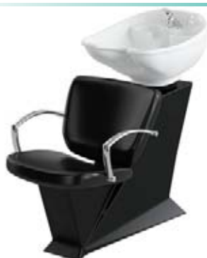
Mycí box Diva.Tech/Carat Běžná cena 14.890,- Akční cena 12.780,-