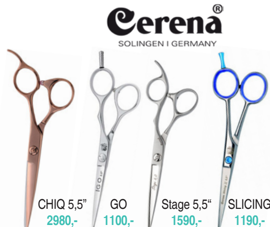
Cerená® SOLINGEN | GERMANY CHIQ 5,5" 2980,- GO 1100,- Stage 5,5" 1590,- SLICING 1190,-