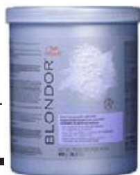
Wella Blondor Multi blonde Melír 800 g Zesvětlení vlasů až o 7 tónů