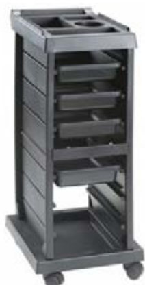
Vozík Salon Akční cena 2.290,-