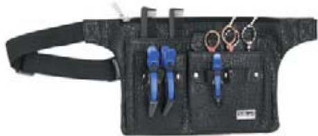
Kapsa na nářadí Belt 3 320 Kč