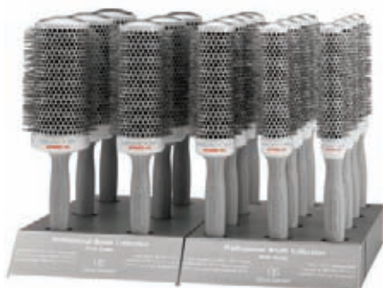
Ø 65 Ø 55 Ø 45 Ø 35 Ø 25 mm 409 Kč 329 Kč 319 Kč 269 Kč 259 Kč Olivia Garden kartáče Speed XL Extra dlouhé tělo kartáče pro kratší dobu sušení