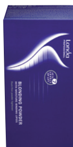
Londa Blondoran Melír 1 kg (bal 2 x 500 g) Zesvětlení vlasů až o 7 tónů