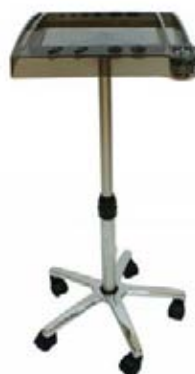
Stolek Smoky s minutkou Akční cena 2.190,-