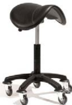
Taburet Saddle XL Akční cena 3.470,-