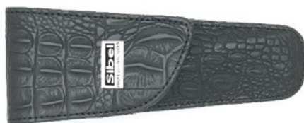
Pouzdro na nůžky Slim Boy 1 120 Kč