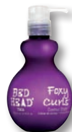
Tigi Foxy Curls Contour Cream proti krepatění a pro podporu vln 200 ml