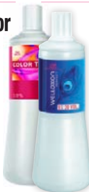
Wella Welloxon 6%, 9%, 12% 1000 ml

(CT emulze 216,-) Běžná cena 359,- Akční cena 233,-