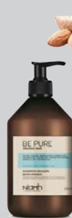
Šampon 500 ml 159 Kč