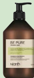
Šampon 500 ml 159 Kč