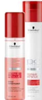
Schwarzkopf BC Repair Rescue neoplachující kondicionér 200 ml (šampon 250 ml 149,-)