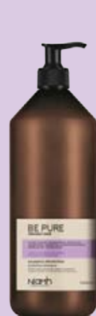
Šampon 1000 ml 198 Kč