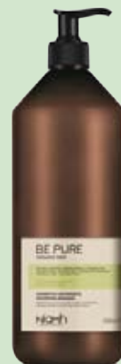
Šampon 1000 ml 198 Kč