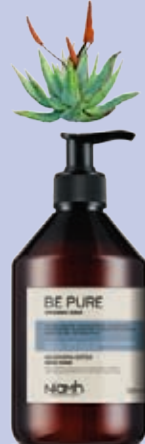
Balzám 500 ml 169 Kč