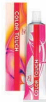
Wella Color Touch Přeliv 60 ml