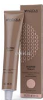
Indola Blond Expert Barva 60 ml