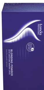
Londa Blondoran Melír 1 kg (bal 2 x 500 g) Zesvětlení vlasů až o 7 tónů