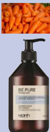
Šampon 500 ml 159 Kč