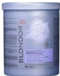
Wella Blondor Multi blonde Melír 800 g Zesvětlení vlasů až o 7 tónů