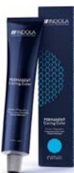
Indola Barva 60 ml