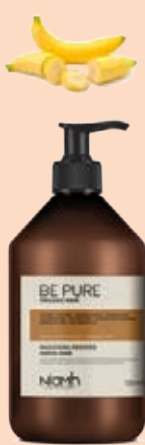
Balzám 500 ml 169 Kč