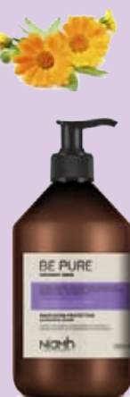
Balzám 500 ml 169 Kč