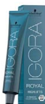
Schwarzkopf Igora Royal Highlift, Fashion Lights 60 ml