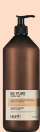
Šampon 1000 ml 198 Kč

Pro vlasy po chemických procesech (barvení a odbarvení). Obsahuje organický extrakt z granátového jablka a měsíčku lékařského. Má protizánětlivé účinky, ochrana před ztrátou barvy, hydratace a lesk.