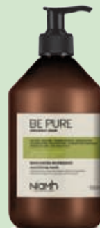
Balzám 500 ml 169 Kč