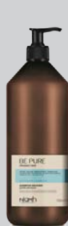
Šampon 1000 ml 198 Kč