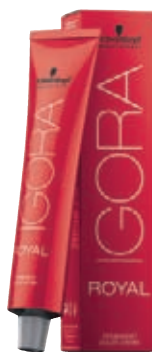
Schwarzkopf Igora Royal Absolute, Metallics, Opulescence 60 ml