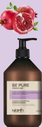
Šampon 500 ml 159 Kč