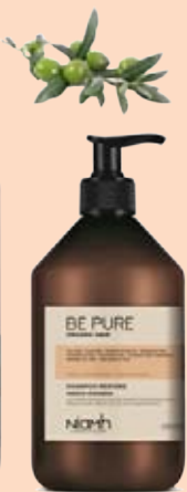
Šampon 500 ml 159 Kč