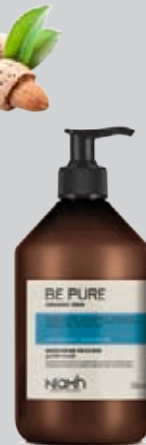
Balzám 500 ml 169 Kč