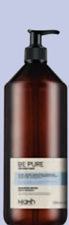
Šampon 1000 ml 198 Kč