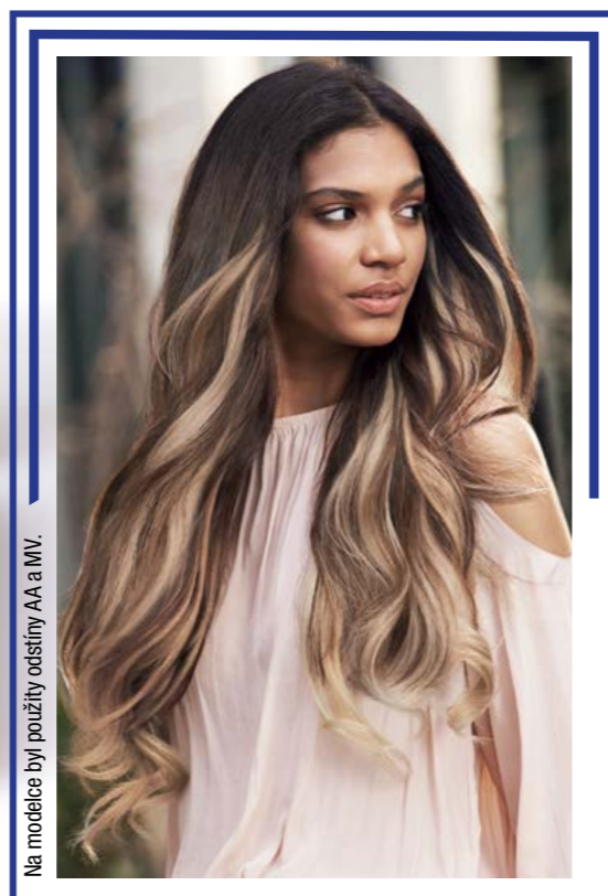
Na modelce byl použitý odstín AA a MV.