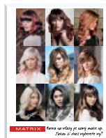
Barva na vlasy je nový make-up