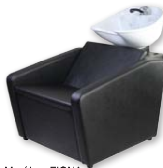
Mycí box FIONA Běžná cena 14.980,- Akční cena 11.990,-