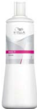
Wella Wave It Ustalovač 1000 ml