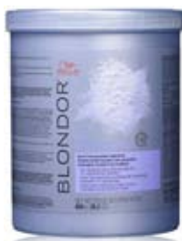
Wella Blondor Multi blonde Melír 800 g Zesvětlení vlasů až o 7 tónů