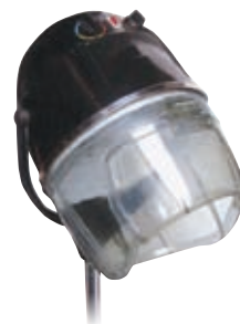
Sušák Hair Style na stojanu (bílý, černý) Běžná cena 2.990,- Akce 2.590,-