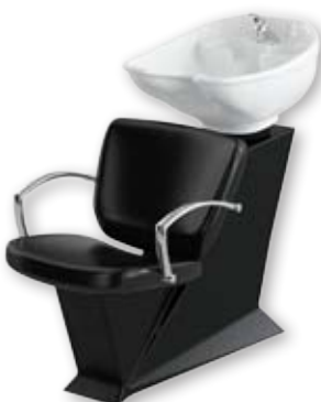
Mycí box Diva.Tech/Carat Běžná cena 14.890,- Akční cena 12.780,-