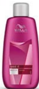
Wella Wave It Zvlhovač Intense, Mild 250 ml