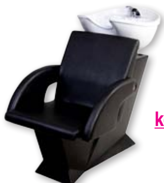
Mycí box DIVA.TECH/AGNES Běžná cena 14.610,- Akční cena 11.690,-