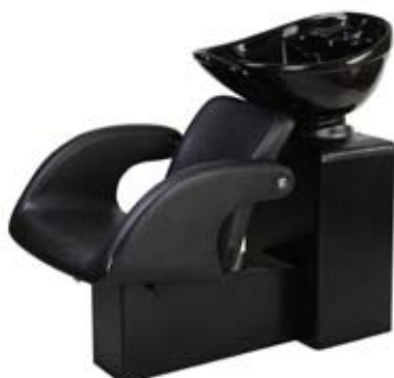
Mycí box VEGA/OMEGA Běžná cena 18.990,- Akční cena 14.990,-