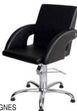
Křeslo AGNES Běžná cena 7.480,- Akční cena 5.980,-