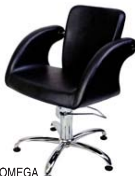
Křeslo OMEGA Běžná cena 8.690,- Akční cena 6.980,-