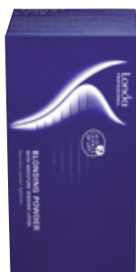
Londa Blondoran Melír 1 kg (bal 2 x 500 g) Zesvětlení vlasů až o 7 tónů