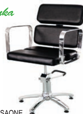
Křeslo SAONE Běžná cena 9.670,- Akční cena 7.990,-