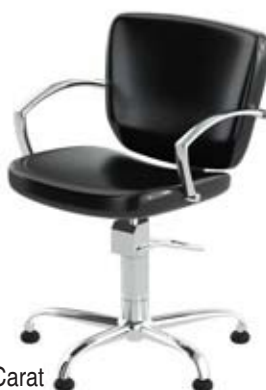
Křeslo Carat Běžná cena 8.720,- Akční cena 6.980,-