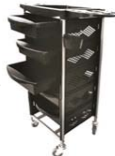
Vozík BRAVO Běžná cena 1.980,- Akce 1.790,-