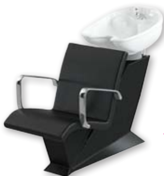
Mycí box DIVA.TECH/AMIR Běžná cena 13.940,- Akční cena 11.160,-