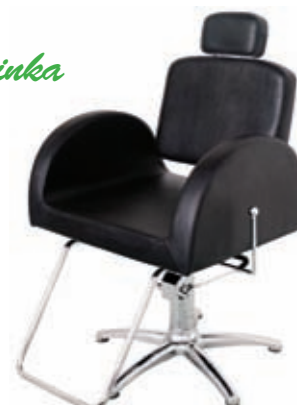
Pánské křeslo RHONE Běžná cena 10.270,- Akční cena 8.890,-