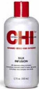
CHI Silk Infusion Přírodní hedvábí, hydratace, lesk 355 ml