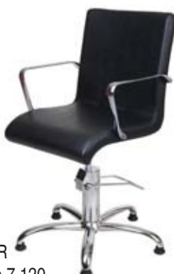
Křeslo AMIR Běžná cena 7.120,- Akční cena 5.690,-