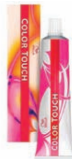
Wella Color Touch Přeliv 60 ml