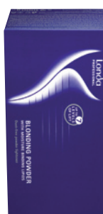
Londa Blondoran Melír 1 kg (bal 2 x 500 g) Zesvětlení vlasů až o 7 tónů