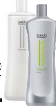
Londa Trvalá N, S, F 1000 ml

(Ustalovač 279,-) Běžná cena 424,- Akční cena 279,-