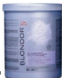
Wella Blondor Multi blonde Melír 800 g Zesvětlení vlasů až o 7 tónů