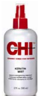
CHI Keratin Mist Bezoplachová Keratinová výživa 355 ml