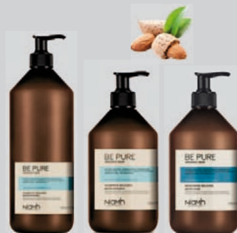
Šampon 1000 ml 198 Kč Šampon 500 ml 159 Kč Balzám 500 ml 169 Kč