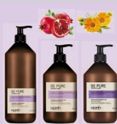
Šampon 1000 ml 198 Kč Šampon 500 ml 159 Kč Balzám 500 ml 169 Kč