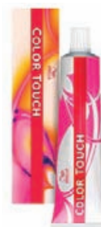
Wella Color Touch Přeliv 60 ml