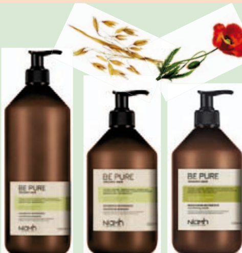
Šampon 1000 ml 198 Kč Šampon 500 ml 159 Kč Balzám 500 ml 169 Kč