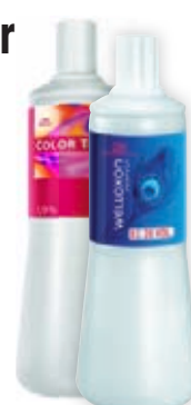
Wella Welloxon 6%, 9%, 12% 1000 ml (CT emulze 216,-)