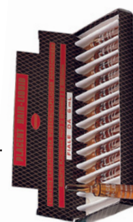
Elidor Placenta ampule Kompletní péče pro jemné a namáhané vlasy 12 x 6 ml