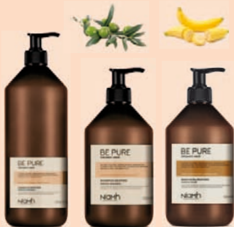
Šampon 1000 ml 198 Kč Šampon 500 ml 159 Kč Balzám 500 ml 169 Kč

Pro vlasy po chemických procesech (barvení a odbarvení). Obsahuje organický extrakt z granátového jablka a měsíčku lékařského. Má protizánětlivé účinky, ochrana před ztrátou barvy, hydratace a lesk.