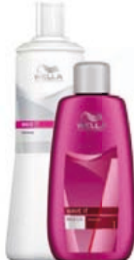
Wella Wave It Zvlhovač Intense, Mild 250 ml

(Ustalovač 279,-) Běžná cena 424,- Akční cena 279,-