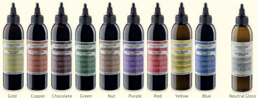
Gold Copper Chocolate Green Nut Purple Red Yellow Blue Neutral Gloss

Buďte kreativní a nabídněte klientkám nekonečné barevné odstíny dle vaší společné fantazie