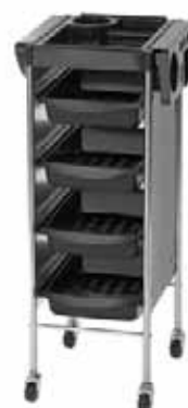
Vozík Passy Akční cena 1.690 Kč