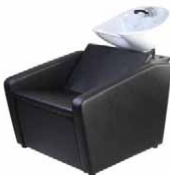
Mycí box FIONA Běžná cena 14.980 Kč Akční cena 12.990 Kč