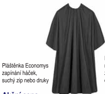
Pláštěnka Economys zapínání háček, suchý zip nebo druky