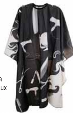
Pláštěnka stříhací Lux černobílá