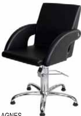
Křeslo AGNES Běžná cena 7.980 Kč Akční cena 6.890 Kč