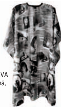
Pláštěnka stříhací HLAVA (modrá, černá, vínová)