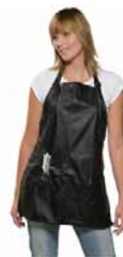
Zástěra Carine černá Akční cena 198 Kč