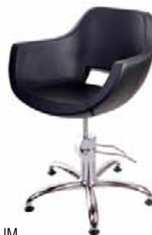
Křeslo OPIUM Běžná cena 7.480 Kč Akční cena 5.970 Kč