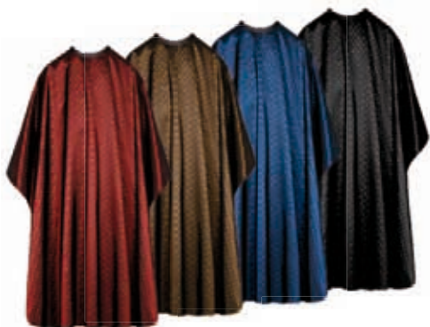
Pláštěnka na stříh, odolná proti vodě Zapínání 3v1, ornament tečky Akční cena 338 Kč