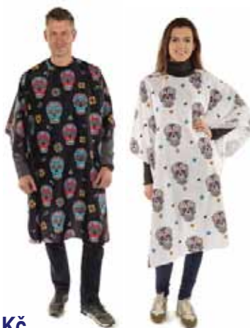
Pláštěnka Mexico černá, bílá Akční cena 366 Kč