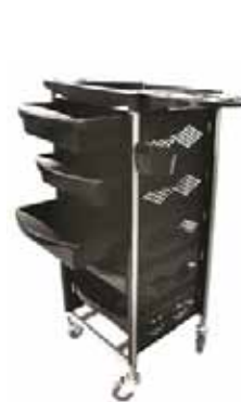
Vozík BRAVO Akční cena 1.890 Kč