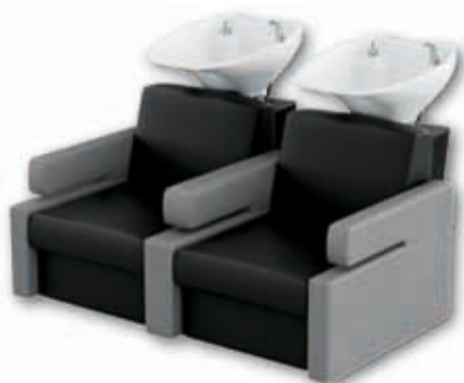
Mycí box DUBLO Běžná cena 35.230 Kč Akční cena 29.790 Kč