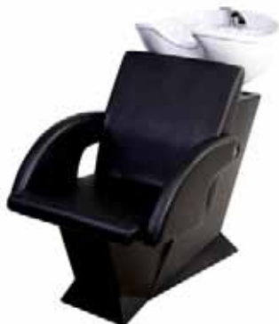
Mycí box DIVA.TECH/AGNES Běžná cena 14.610 Kč Akční cena 12.790 Kč