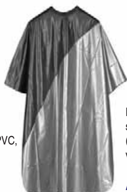
Pláštěnka na barvu NORA zapínání na s.z., PVC, délka 102 cm