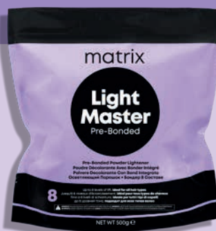
Light Master Pre-Bonded